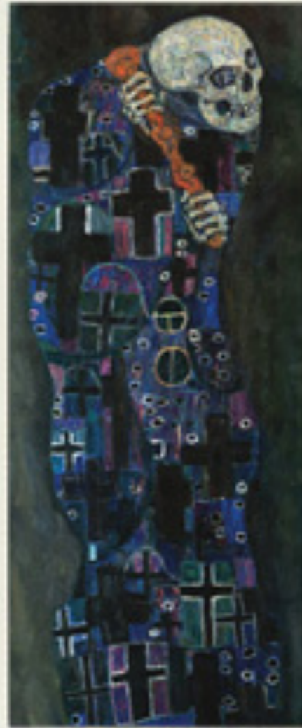
MORTE E VITA